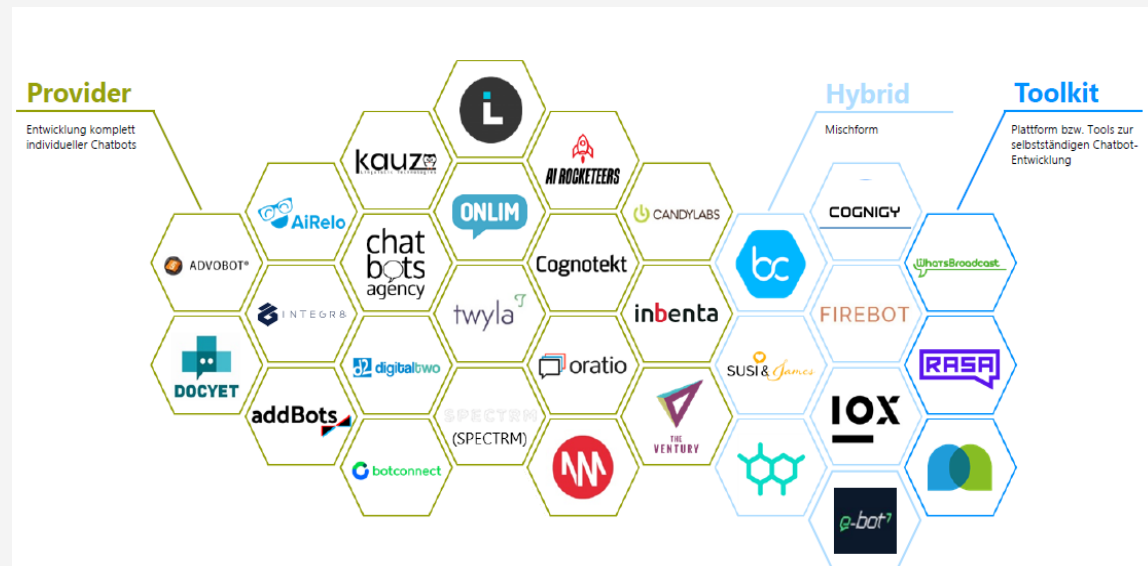
New Players Network, 2018